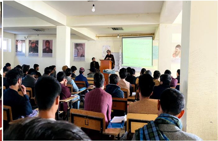
20. تدویر سمینار جهت آگاهی دهی سیستم لایحه کردیدت برای محصلان جدیدالشمول پوهنچی ادبیات و علوم بشری.