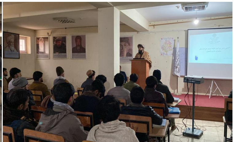
21. تدویر سمینار تحت عنوان: ( بررسی مدیریت اضطراب امتحان ) برای محصلان پوهنچی ادبیات و علوم بشری.