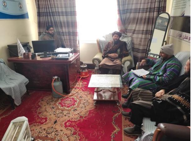
تصاویر از جریان ارزیابی آمرین دیپارتمنت های پوهنچی ادبیات توسط رئیس اداره.