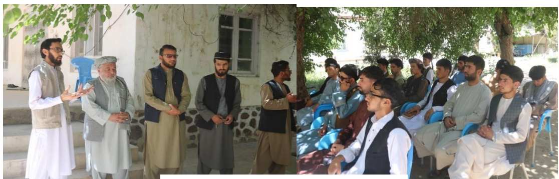
تلویزیون ملی فاریاب