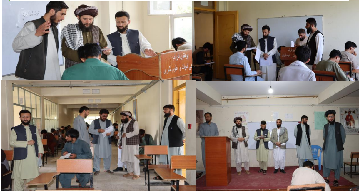
نظارت از جریان اخذ امتحانات برنامه شبانه این پوهنچی.