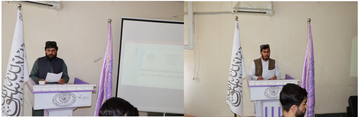
دفاع پایان نامه های فارغین.